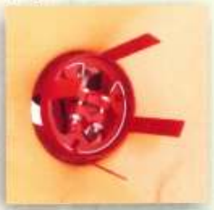
Stirring Device El Agitador